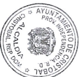
SRA. SANDRA PEÑA PLATA Alcaldesa