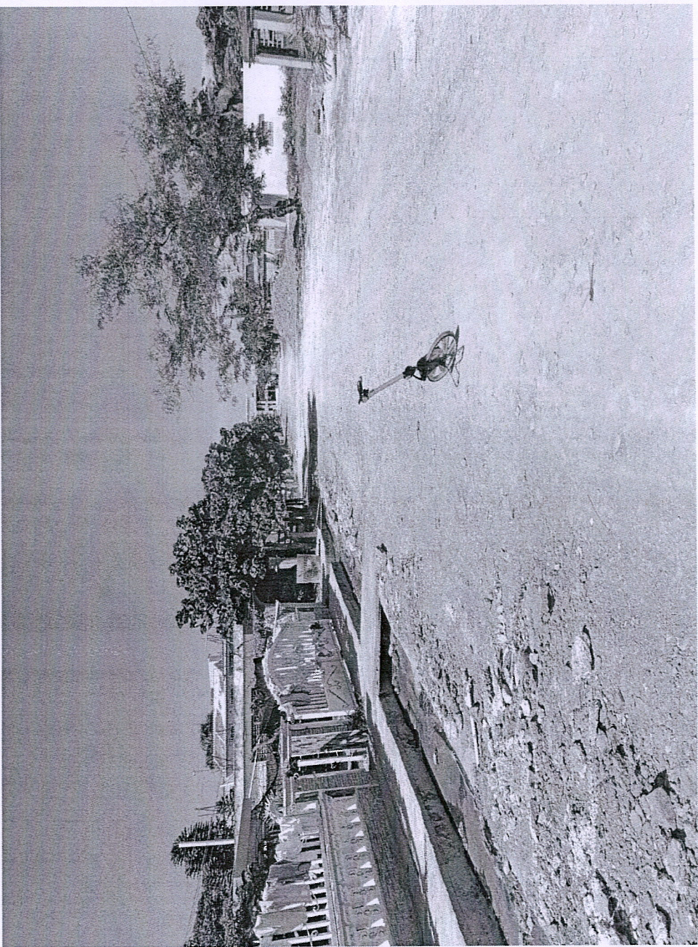
CALLE ROSA JULIA