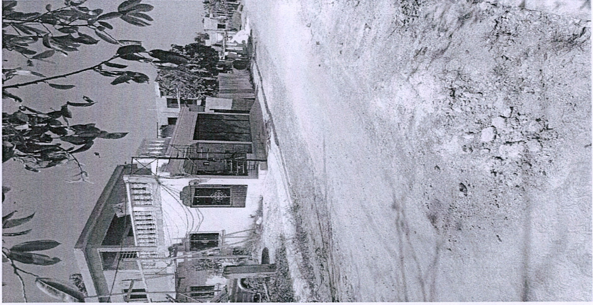
C/ General Santana