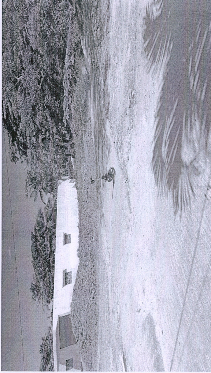
C/ ROSA JULIA