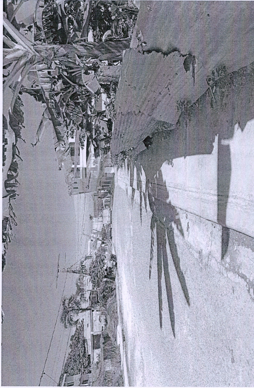
CALLE LOS TRAMIARES