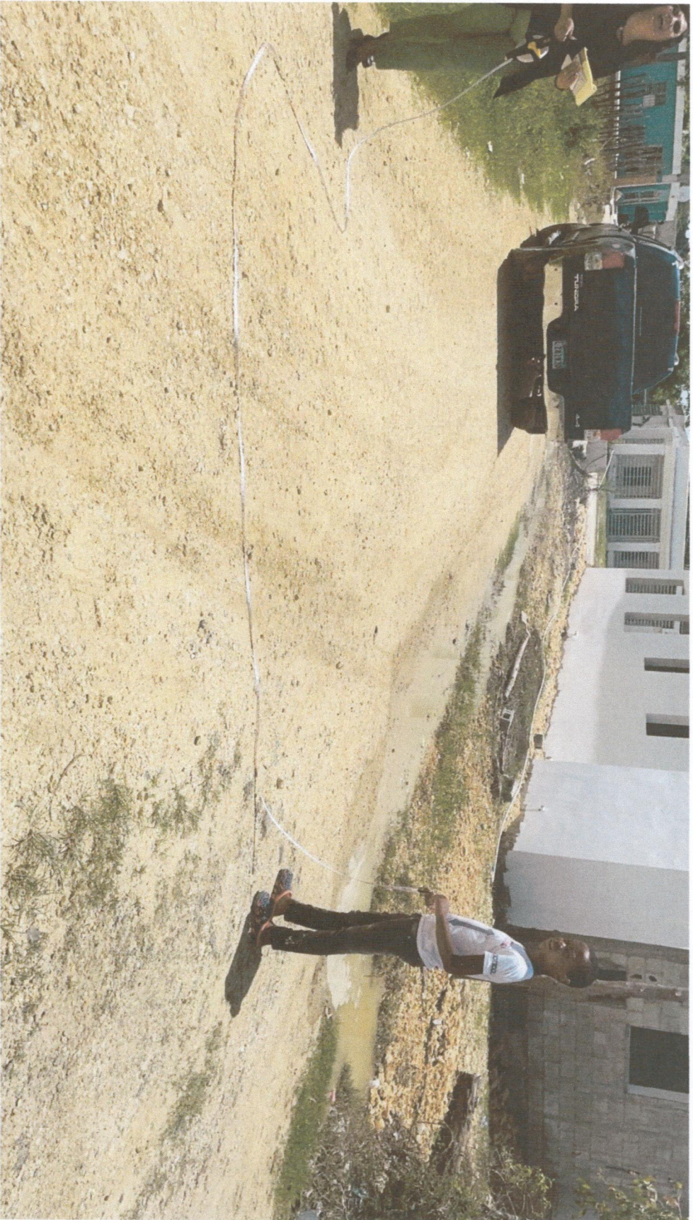
INICIO CALLE NO.2 -1