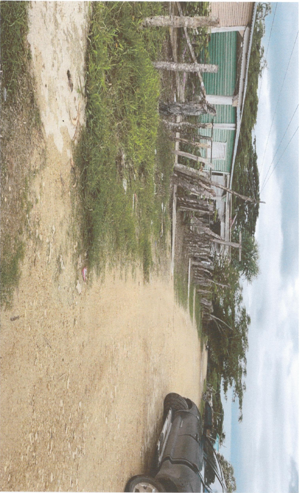
INICIO CALLE MARGOT IZQUIERDA