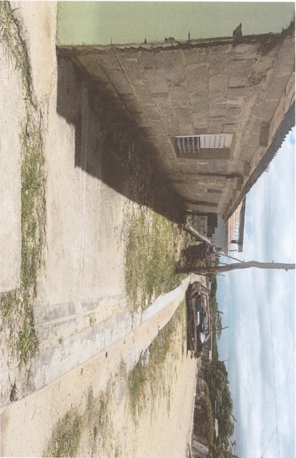
FINAL CALLE PREVISTERIO P. CARRASCO