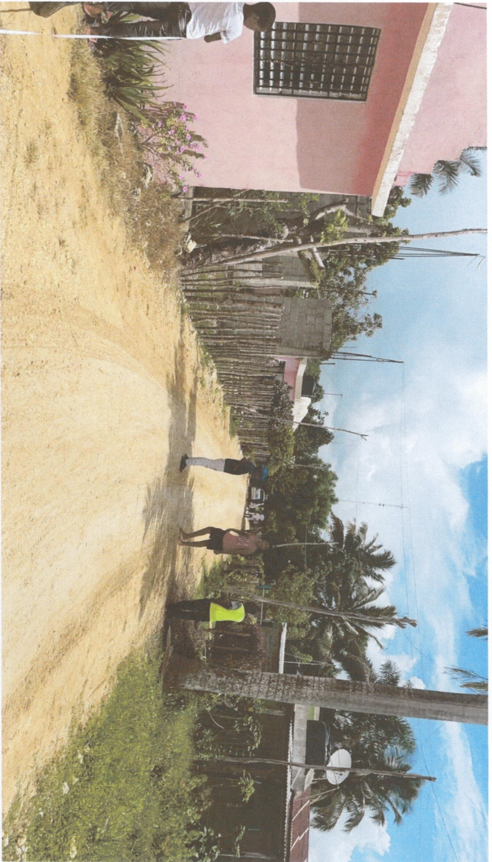
INICIO CALLE SERGIO SANTANA