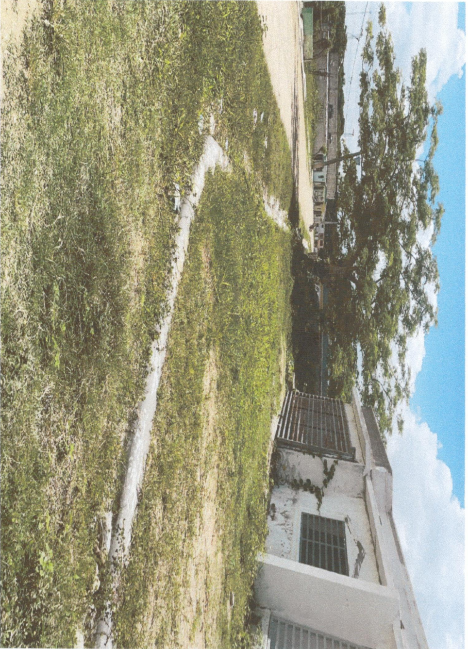
INICIO CALLE NO.2-2