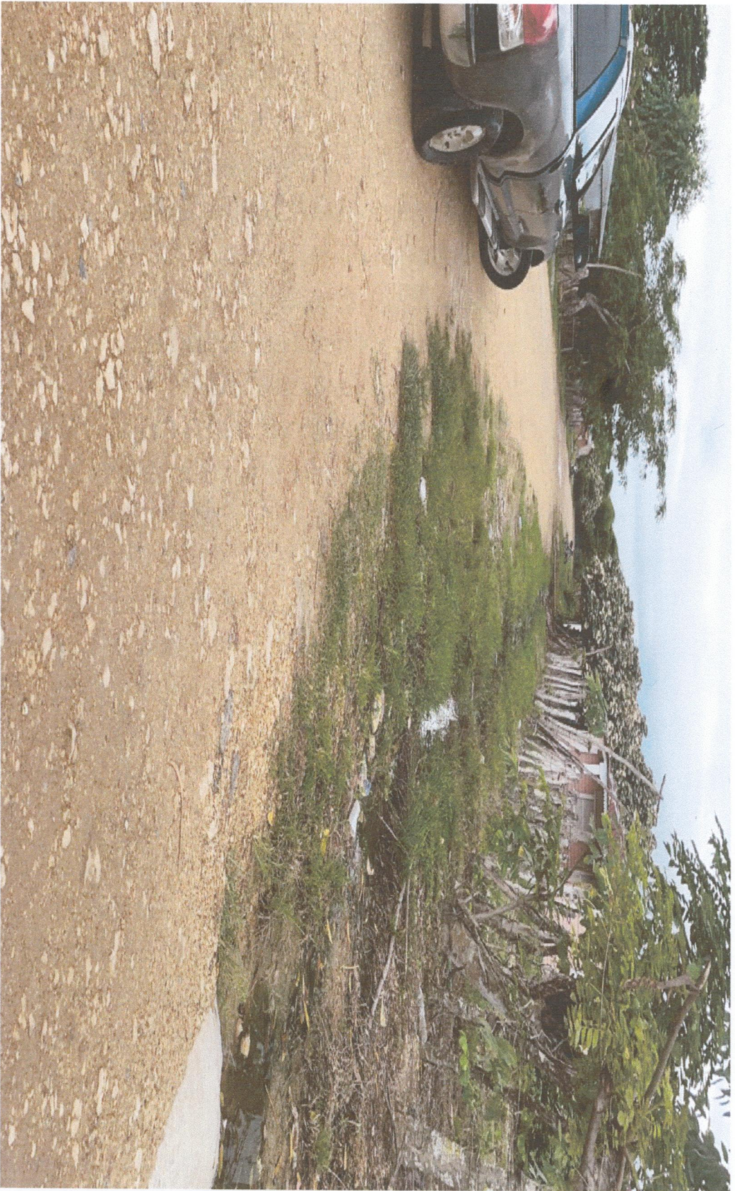
INICIO CALLE MARGOT