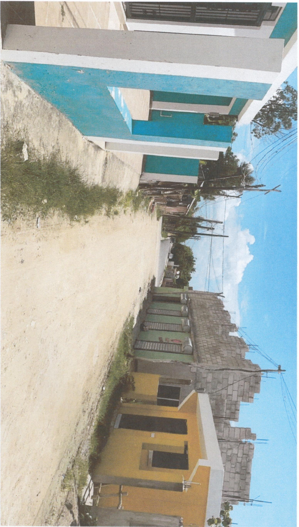
FINAL CALLE SERGIO SANTANA