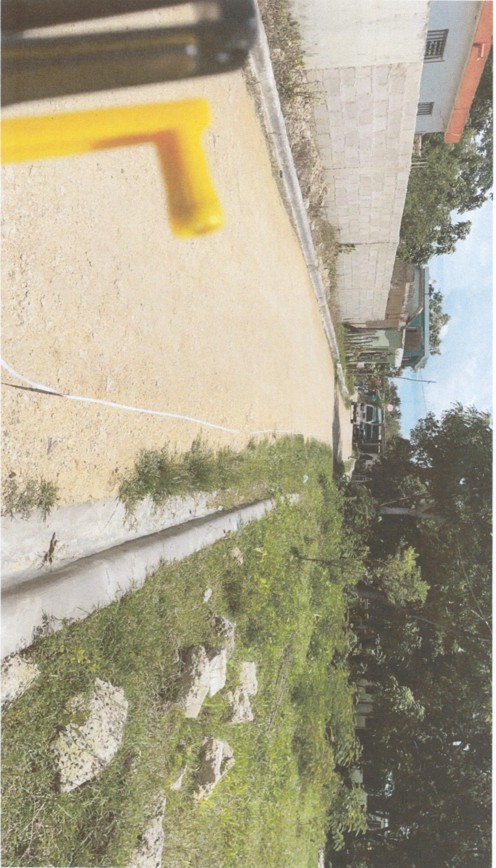
INICIO CALLE PREVISTERIO P. CARRASCO.