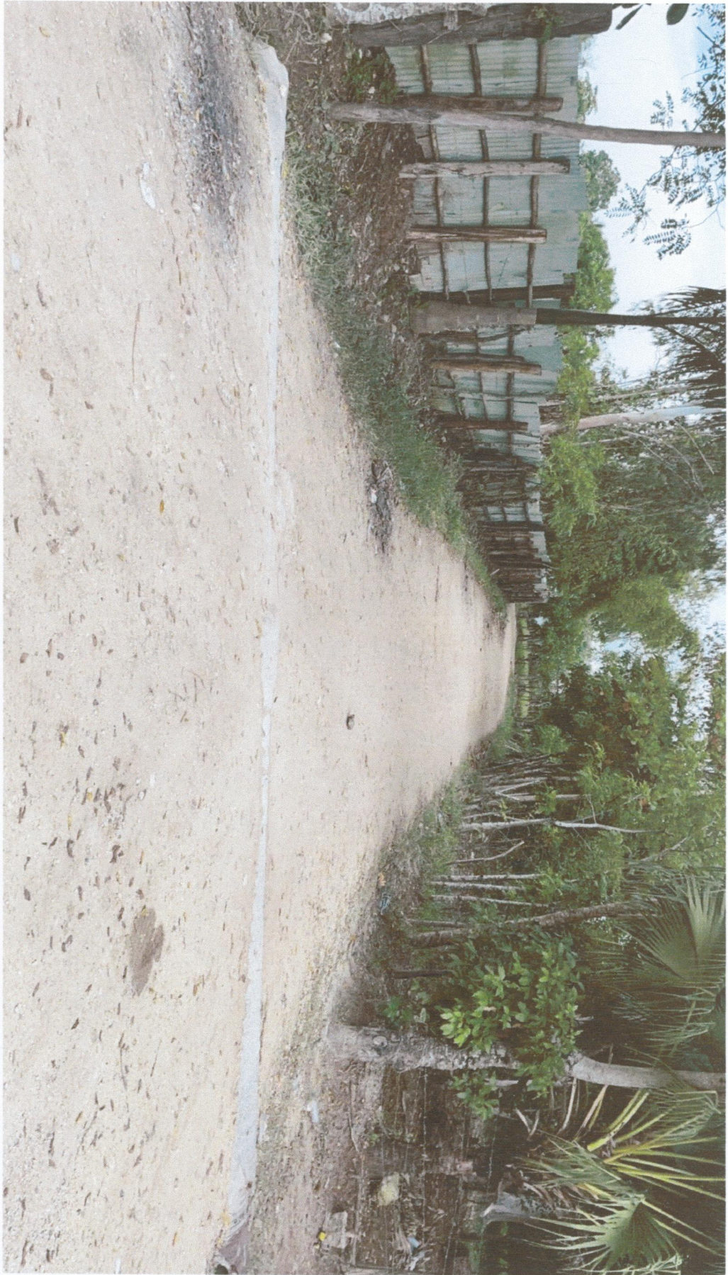
FINAL CALLE MARGOT ESQUINA 26 DE FEBRERO