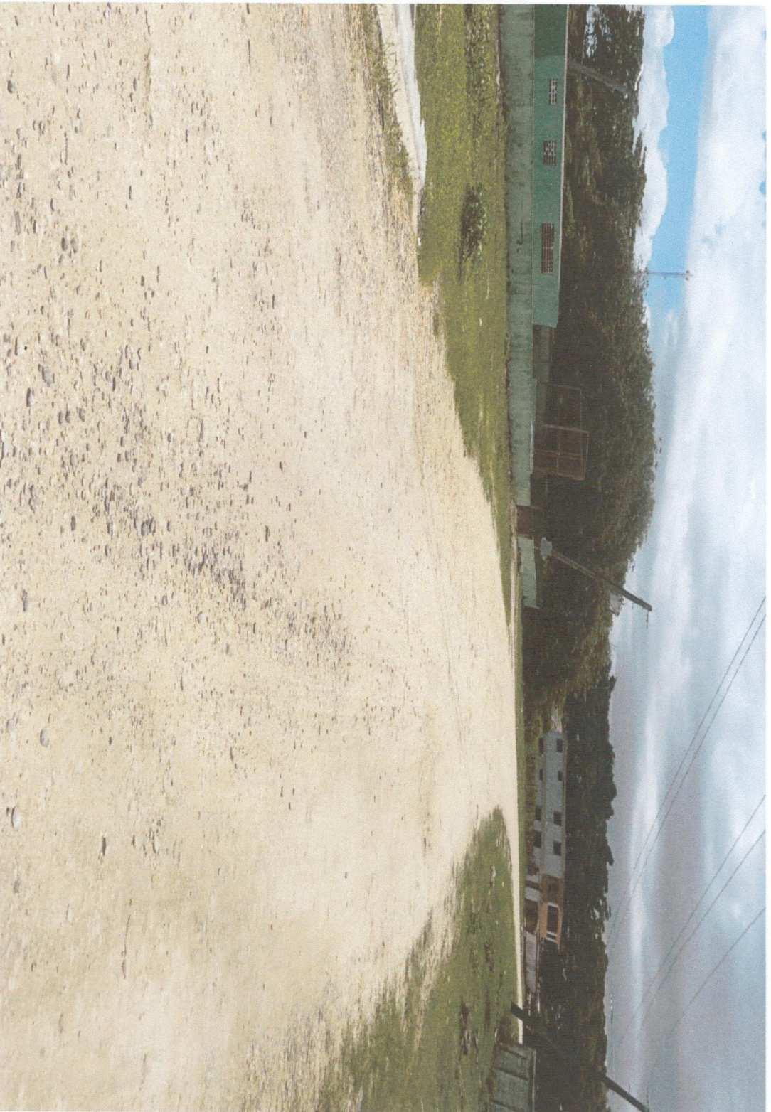
FINAL CALLE 2-2