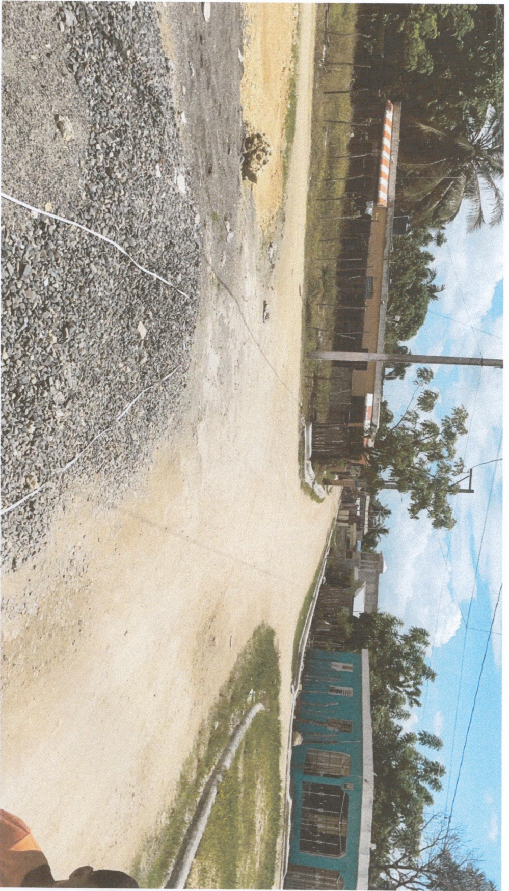
FINAL CALLE 2-1