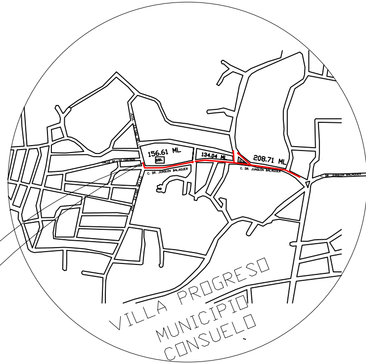
PLANO DE UBICACION NO ESCALA VILLA PROGRESO