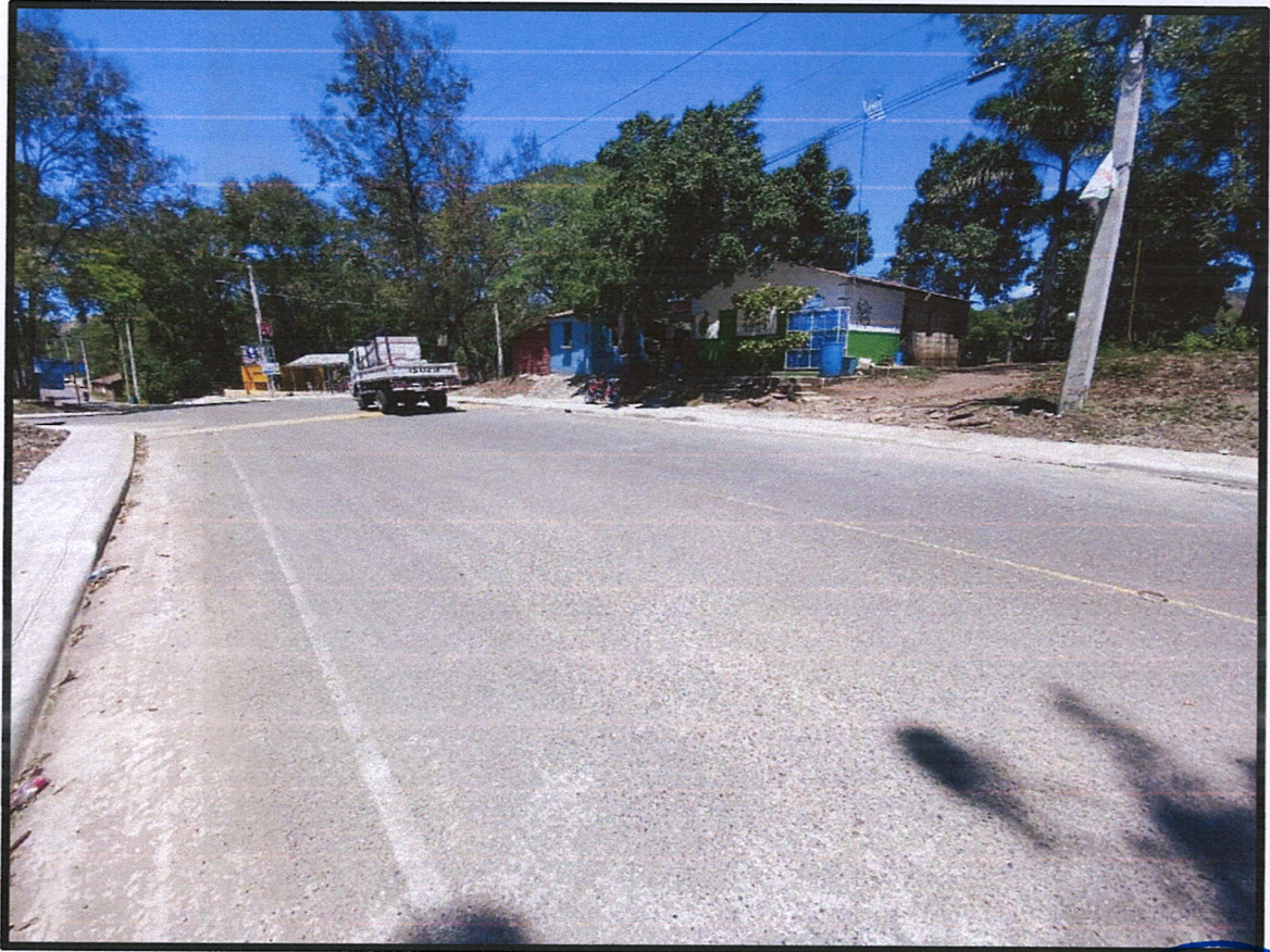
Imagen No. 4: Aceras y contenes Calle principal el Rubio (Lado izquierdo y derecho)