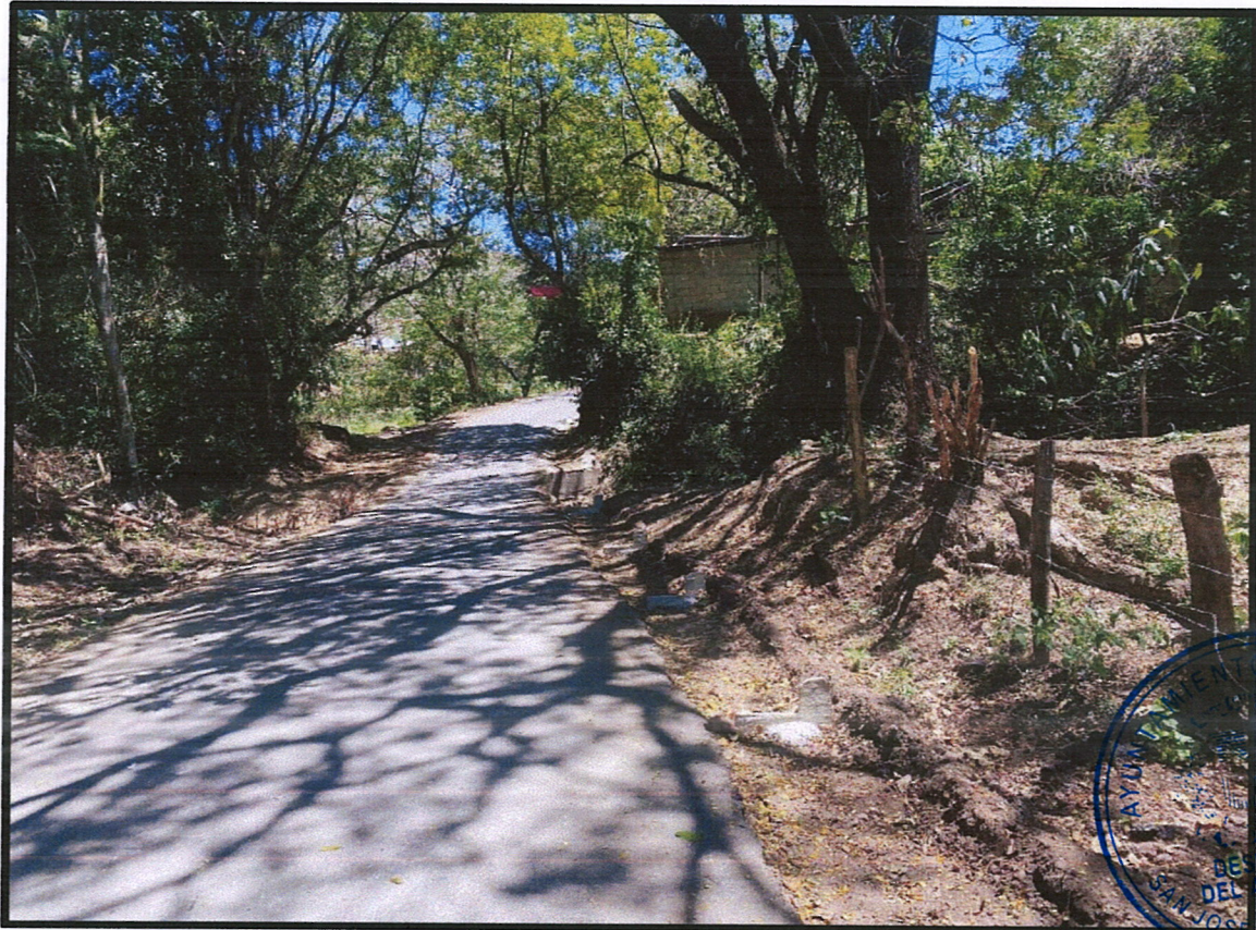
Imagen No. 3: Contenes en calle desde Puente a Escuela Ana Dolores Torres (Lado Izquierdo)