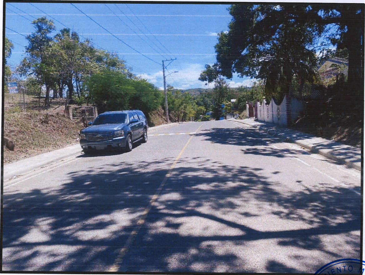
Imagen No. 6: Aceras y contenes Calle principal el Rubio (Lado Izquierdo y derecho)