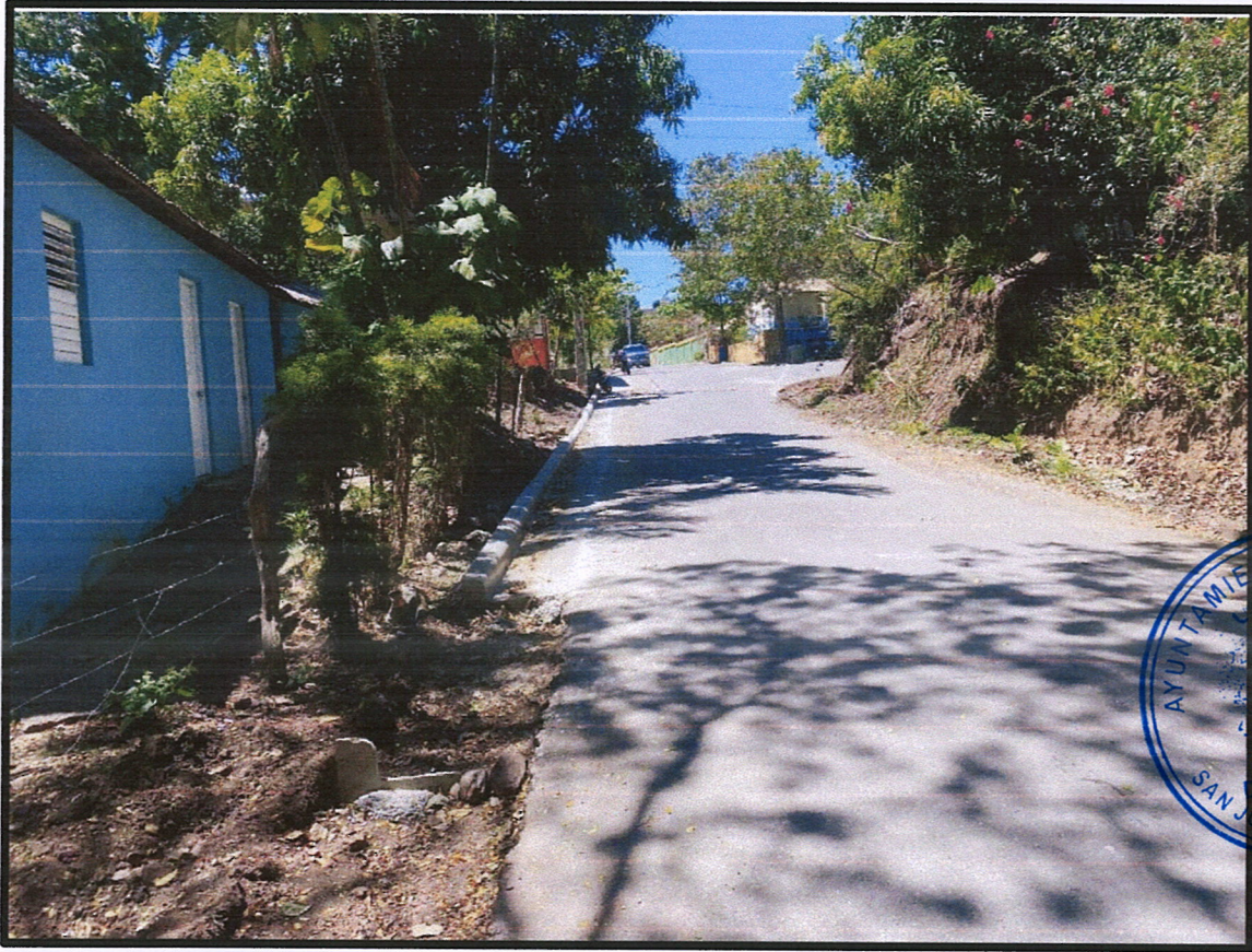
Imagen No. 2: Contenes en calle desde Puente a Escuela Ana Dolores Torres (Lado Izquierdo)