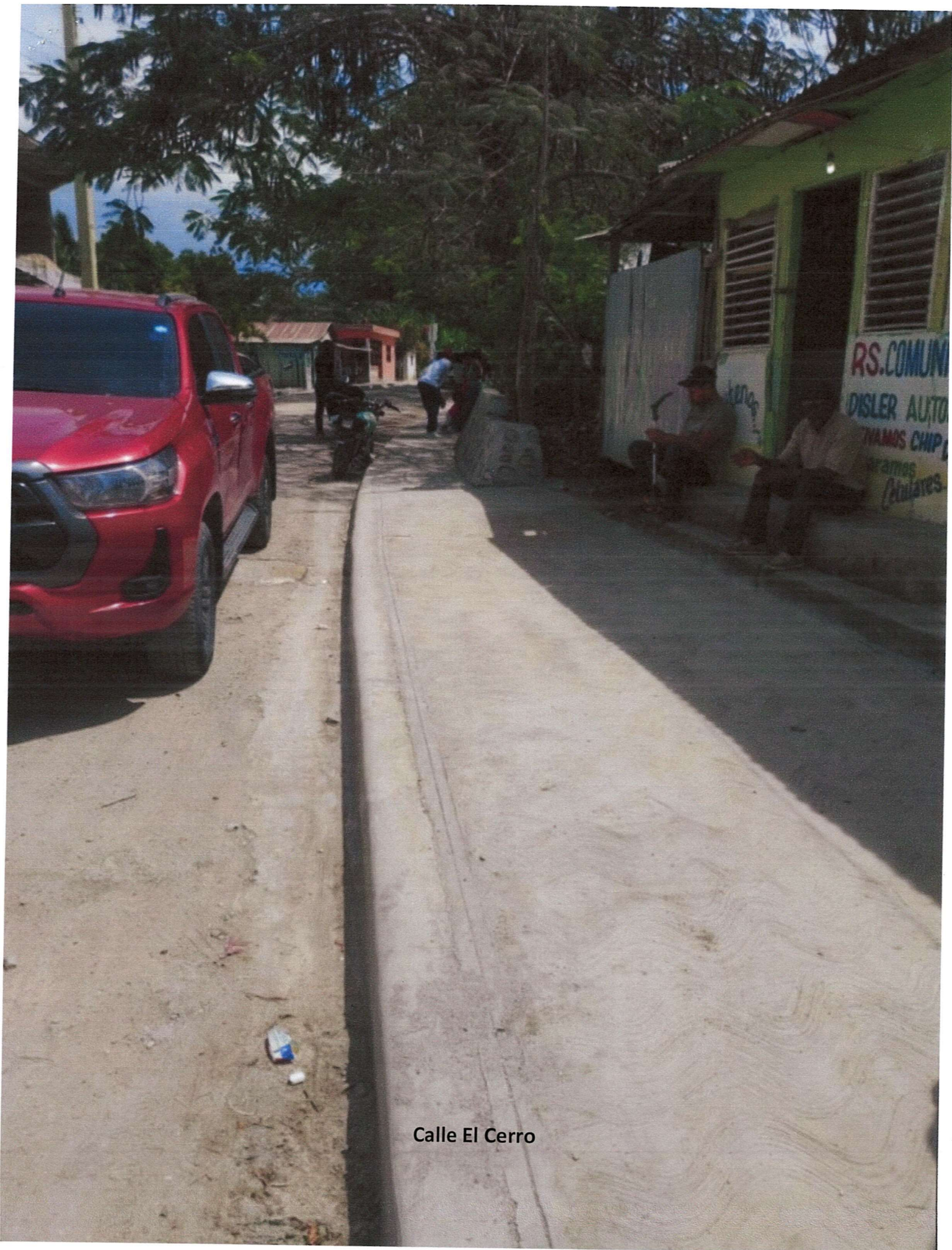
Calle El Cerro