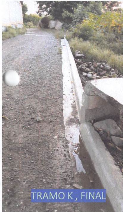
TRAMO K, FINAL